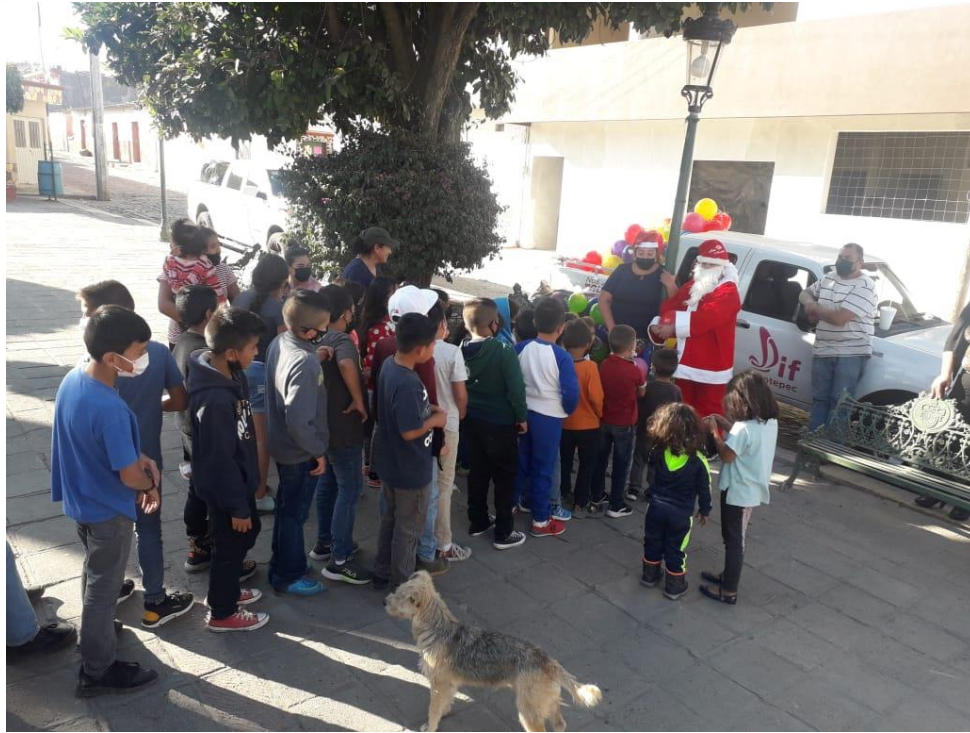
Ilustración 33 ENTREGA DE PELOTAS POR FESTEJO NAVIDEÑO

https://www.facebook.com/JocotepecDIF/posts/pfbid0QfmMssaXpTSpoXwVkJGbA8vptPr4wcjKfHNkbie34FwV2b9k6S2TzP2tVU9rzBuil?_cft__[0]=AZXLXgZqclNdDV8HTpQ9XdbHwtJ5pv2uJrWPGF4fWOJxIMf1Vcu2-r3Uu00FN3SGNFN8fiQcDSUQJ8cOqVXI3PJHj-9bkMp5Xz_hZRh5tCtq7CmCw5HhKkfKFAB9a5hui0q7Dnh6aWXaHw6dN7kEWIE6b7sv2l2ZjgC0olotcq71ZykSMY9RaruqaTu0Ncunl_sXMuLnpYa0xKo0_izPftl&_tn=%2CO%2CP-R FESTEJO DEL DIA DEL NIÑO