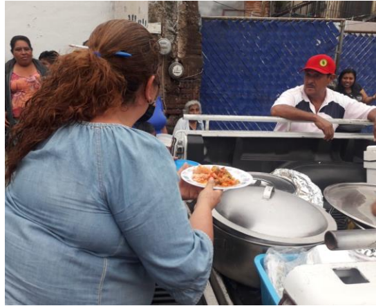
Ilustración 26 ATENCIÓN A DESLAVE DEL CERRO EN SAN JUAN COSALÁ