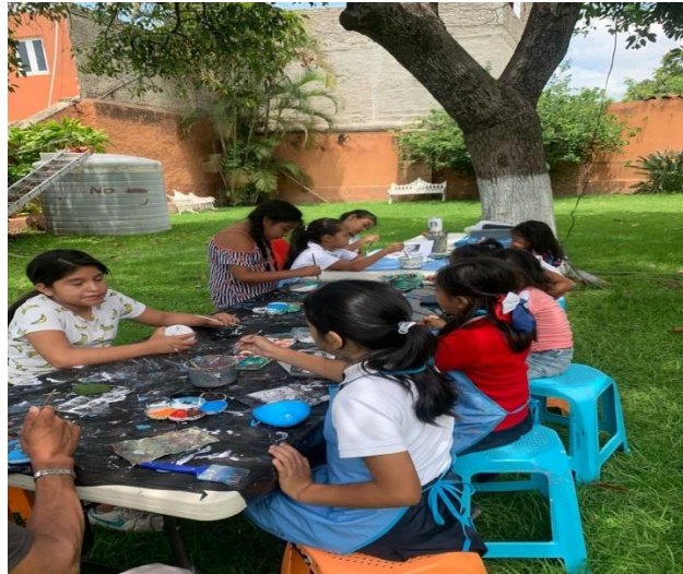
Ilustración 10 Pintura en piedra San Juan Cosalá