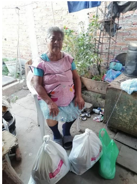
Ilustración 25 ENTREGA DE SPENSA JALISCO SIN HAMBRE APCE SAN JUAN COSALÁ