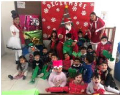
Ilustración 17 Posada CAIC 2021

https://www.facebook.com/JocotepecDIF/posts/pfbid02zorS3Dn8f1JocfZ9Y21Jib1ZVP9wzAeiHosa uqy2homrmNzqPwysMK4mxdBbC1rtl?_cft_[0]=AZUAuLqkAtsjRoistGfLx2zj7-nlEgJ2AH3wIPt_YMJVfKFAiPklnAe1aWGb5XlxA6p1GISLS0PYidGIPChxPXwPqZ_ilhd9y413oM5-8RqD8pAyb4Aod2B0Ehn8-8weYly6vlBO0V_C0gFuaAY63lhmEINks_vCuNnpzEG5N6KkU2Jvmo6Z70DqTH-QjPGXFQ-qZE9PVIR1RZMicoei5hUq&_tn_=%2C0%2CP-R VISITA AL ZOOLOGICO Y SELVA MAGICA