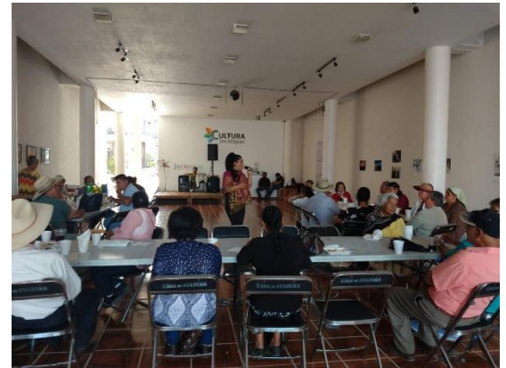
Ilustración 19 Festejo día de las madres grupos de adultos mayores

https://www.facebook.com/JocotepecDIF/posts/pfbid0FKKS3zArmWB41CbQd6EWacSEcCip36V4cDnENT59k7wrZDwAVzMXXTJpeT8PNuG1?_cft_[0]=AZWm tYF7loej5xp7LkklvIOOz2qcv8xleSerA OBdTf1q3c0KhkNpQP-7vGjsO06jOsQAmHxkXedwHYaM_ia3kGjzSKVWM97d54FK2f00mrhYFKJM1LE9c2Fr8bpKcUKuBFFcXo8AApypYiBhK5v2cbKJiJ3DvaEnkmaRdXUA3OhYbgD_s8OqL07Mcu7ax7XTCet86g2TOIIXSubxcgb6qE6&_tn_=%2CO%2CP-R FESTEJO DEL DÍA DE LA MADRE EN PLAZA PRINCIPAL