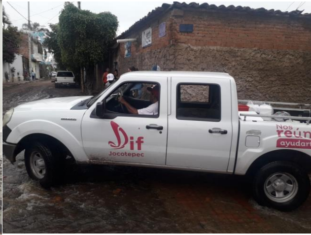
Ilustración 28 COORDINACIÓN APCE CON PROTECCIÓN CIVIL