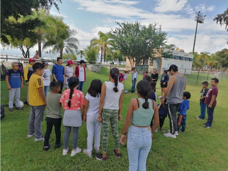
Ilustración 39 Día recreativo

https://m.facebook.com/story.php?story_fbid=pfbid0MmUpp7uQWuciGwK9Xm3G6eARjexaJaaZa5XxRhxZpqJnNtKfIBTzuZ8UGh2oECBI&id=100064359714989&sfnsn=scwspwa Certamen “Embajadora de los adultos mayores Jocotepec 2022”