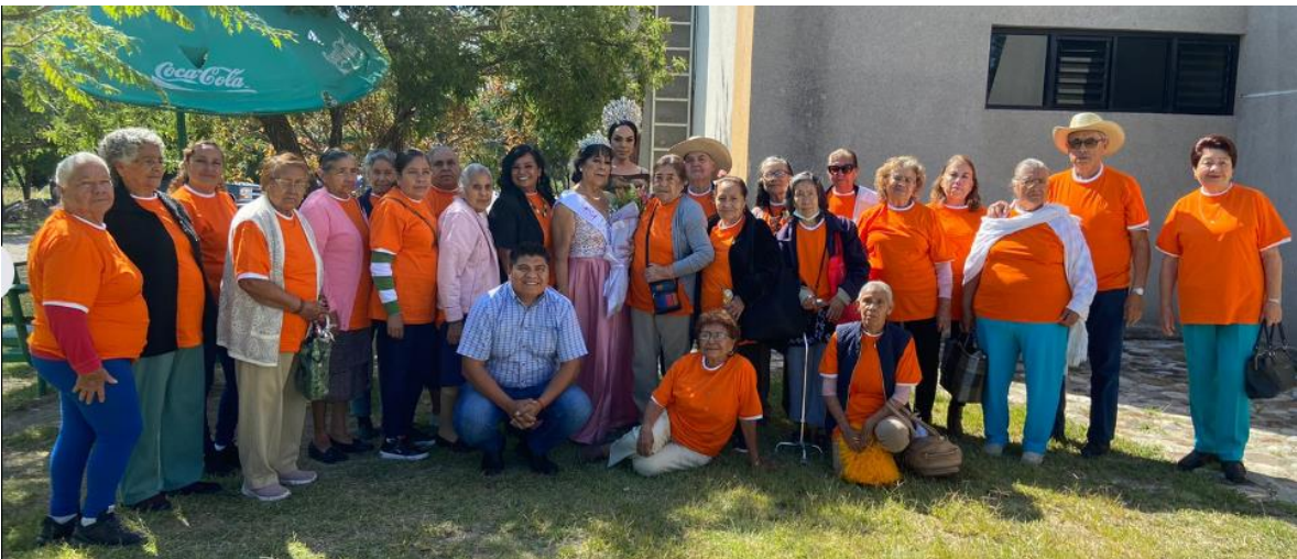
Ilustración 40 certamen regional embajadora de los adultos mayores

https://www.facebook.com/JocotepecDIF/posts/pfbid02yT9jdpGyU4H4BitpCJa44KYFVjz3uCdF9B36yUzFAEqLN3hV4MrrxyKiXyp36ZJdl?_cft_[0]=AZVtyCPEV0WIYkZA7ovelWm82KS3GsZnXRdsHw9BWhrV4Dr9A4lby1sEeS9Mu0MxutWrw-O5y2FgL8vpDjT4HWnes9i9OLQwrJJuQyftsqqx-x2iVB6TN0exjH6YJRx0wXRM6wYPKR4PIYyFJzsuuGYdMPSf31BBgJfqBxI8YSWVNUiqnFYma3TnfKBZhyLnIM7ILEwSmXN8StMz93c0rf&_tn_=%2CO%2CP-R Pláticas de salud en conmemoración de la semana de las personas adultas mayores