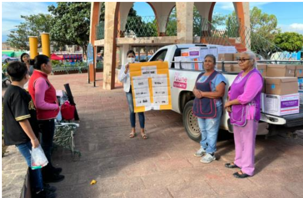
Ilustración 1 Pláticas de orientación alimentaria y entrega de despensas PAAP