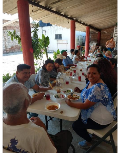
Ilustración 21 Día de las madres comedor Zapotitán