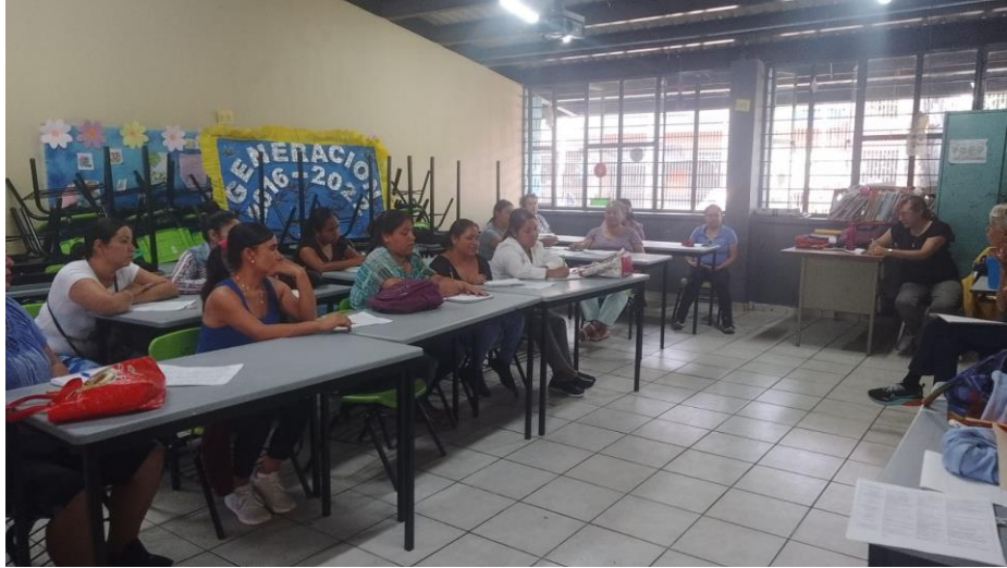
Ilustración 14 Escuela Comunitaria para Madres y Padres de Familia