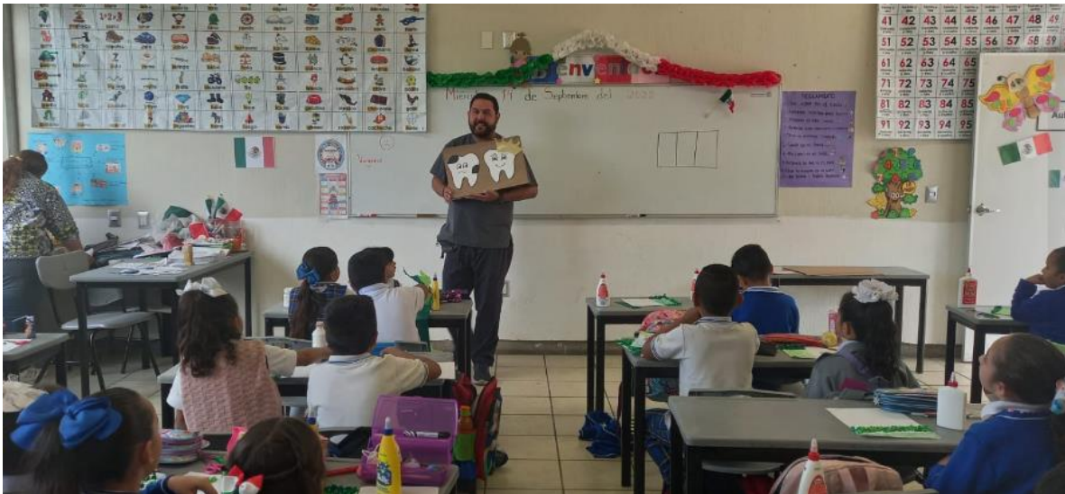
Ilustración 41 Pláticas de orientación en salud bucal

https://www.facebook.com/JocotepecDIF/posts/pfbid0KHMWgMFMX15JCUN85yNAWGSJA9YXHXtmTHY6VFCEHwfsHteo5WPAAnu2mV9AwTLI?_cft_[0]=AZUhCl8-C-jiI5zOMVucusQlyKZF9VUe2xc5aG8wl4PluFCTMchTLkXhr7O6uj--LQFaMLBIXra7fvSuefOufhk1rjY-GbGlaz0iSbLk7mAqUYvMrwCEBAkoXBK17nsc23jOrHjnlSwqt7lom0R6b9CEm23_FYWW5NahMZGUWDGgak5vir8GI38wLU0JjgFNlutaOmtaK4IGK3JHEJqN4U36h6rCLg3AHvXgHzTR7CzZuYsqB0vehuyyLEcwYYpXcgOQ&_tn_=%2CO%2CP-R Inauguración de biblioteca