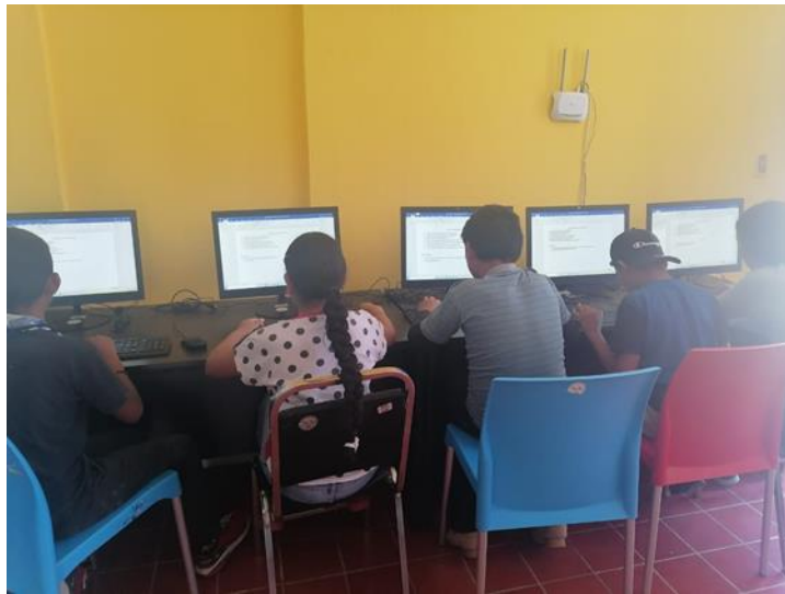
Ilustración 9 Taller de computación Potrerillos

https://es-la.facebook.com/JocotepecDIF/videos/un-gran-proyecto-para-beneficio-de-ni%C3%B1os-y-adolescentes-mediante-actividad/398787948373929 VIDEO REEQUIPAMIENTO DE LUDOMOVIL EN CASA DE FORMACIÓN DE EL CHANTE