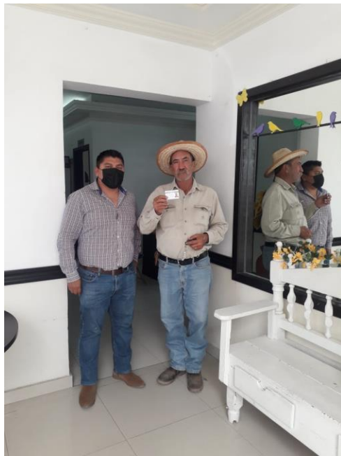
Ilustración 30 ENTREGA DE CREDENCIALES INAPAM