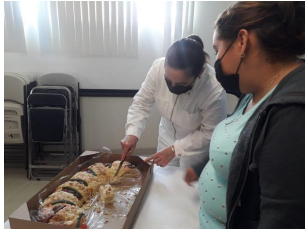
Ilustración 31 ROSCA DE REYES CON ADULTOS MAYORES