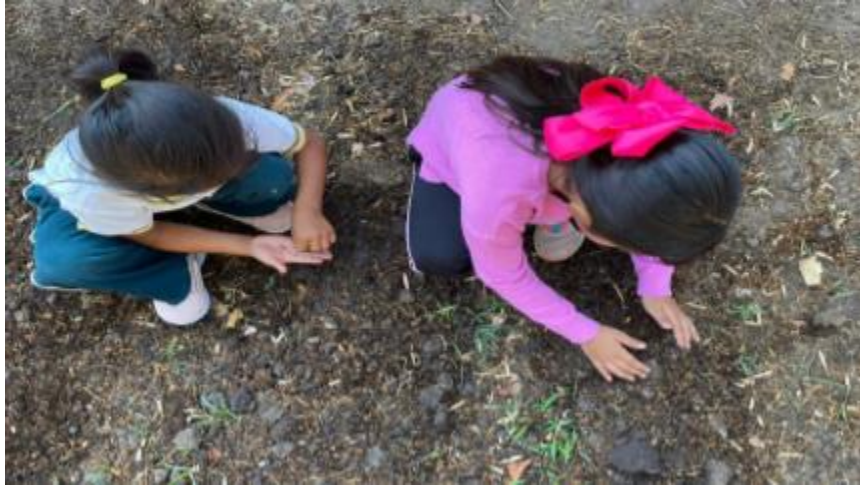
Ilustración 8 Huerto escolar desayunos escolares

https://ne-np.facebook.com/Jocotepecgob/videos/1118078455403952/ Video de entrega de cocinas Menutre