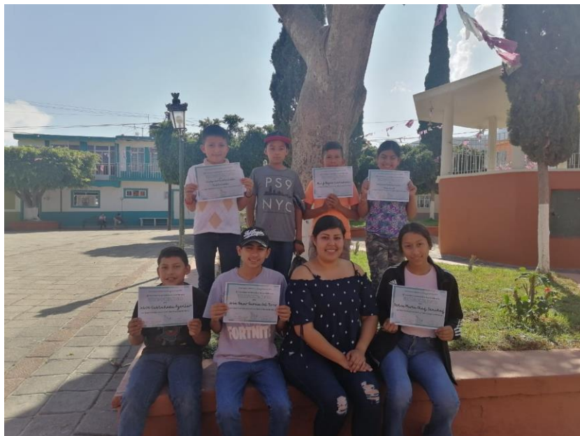
Ilustración 13 Taller de prevención

https://es-la.facebook.com/100064359714989/videos/906735189992638/?_so=_permalink VIDEO DE REEQUIPAMIENTO DE TALLER DE PANADERÍA EN EL MOLINO