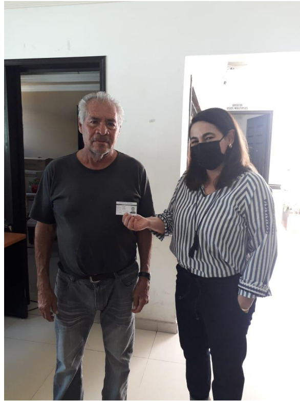
Ilustración 29 ENTREGA DE CREDENCIALES INAPAM