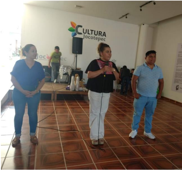
Ilustración 18 Semana de la amistad CAIC