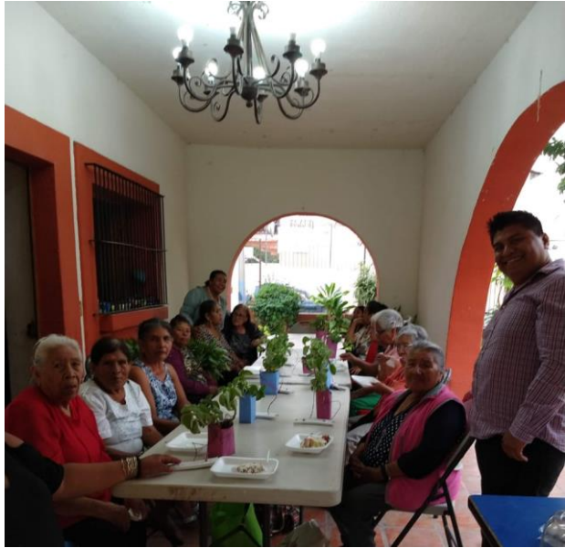
Ilustración 24 Día de las madres comedor San Juan Cosalá