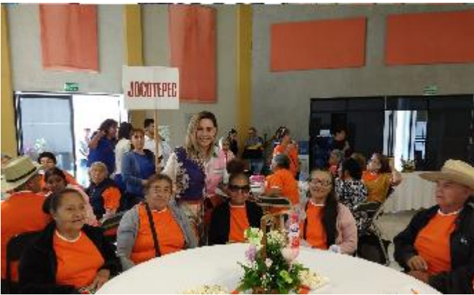
Ilustración 35 certamen regional de la embajadora de los adultos mayores Jalisco 2022

https://www.facebook.com/JocotepecDIF/posts/pfbid0NAfUjFbyciy21hUYsvFH2n26Jy5onFUm65jUfcFHndVriJhZguokaCEbxwAk24vyl?_cft__[0]=AZUIPiZG1330nqtRXIf3aP68TNjsu8bCbJlWYt1NopwbKfrJ5ym7xaPmsRPqBZTqIYJSE7eNdwwDTDdzFTDIOVxEhsSo9hN3m5etptaEXjjZANIKLmRLGfvPdWPBfq-eHCrzAAFzPUJirnjdXWkvKrC4Biv7dEVM9L7GYNS0MTsV2dR3min0_8k4jErwvJ-wjbHGL-HJfcJGMT-SR7xyl&_tn=%2CO%2CP-R Certamen embajadora de los adultos mayores Jocotepec, 2022.