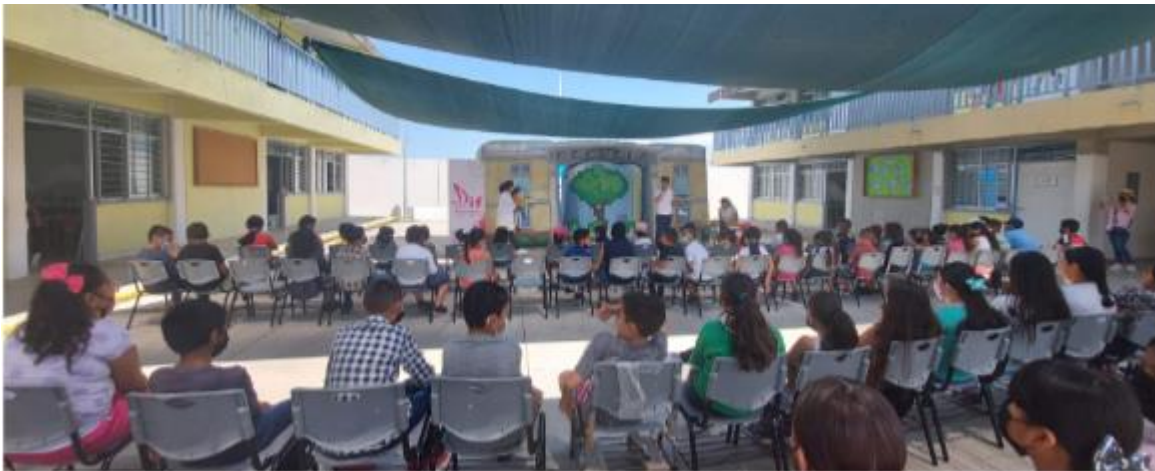
Ilustración 5 Obra de teatro "La buena alimentación" desayunos escolares