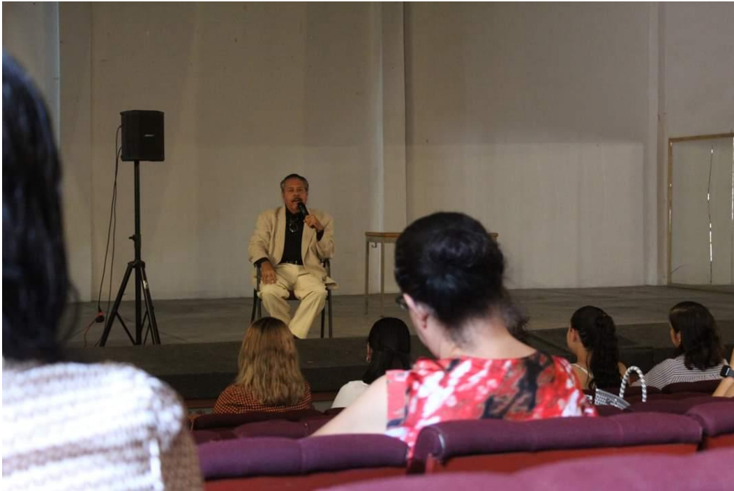
Ilustración 37 Conferencia Técnicas para el manejo de la ansiedad