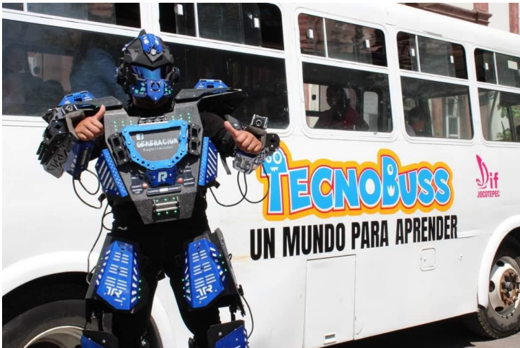
Ilustración 38 Inauguración de Tecnobuss