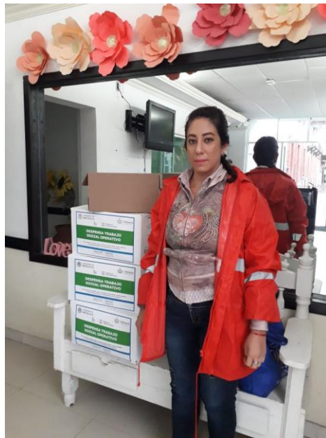
Ilustración 32 ENTREGA DE DESPENSA TRABAJO SOCIAL

ENTREGA DE APOYOS ASISTENCIALES TRABAJO SOCIAL