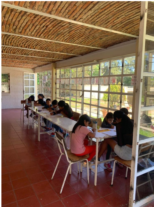
Ilustración 11 Taller de prevención Chantepec