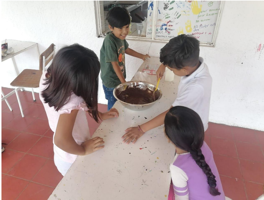
Ilustración 12 Taller de panadería

https://es-la.facebook.com/100064359714989/videos/906735189992638/?_so=_permalink VIDEO DE REEQUIPAMIENTO DE TALLER DE PANADERÍA EN EL MOLINO