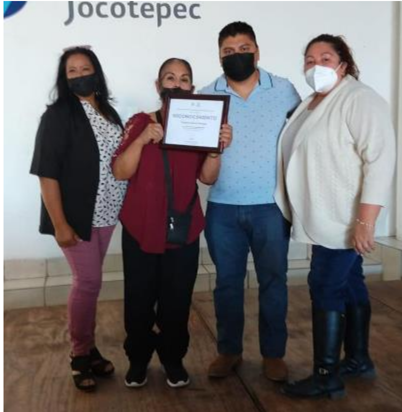
Ilustración 34ADULTO MAYOR DISTINGUIDO

https://www.facebook.com/Jocotepecgob/posts/pfbid02XMMJYgbRLEUpyiHQKFGUTMLwBxcfdjrk3YncPKJ9E4Z6Zt3NF7XKE3QBpmjmJc34I?_cft_[0]=AZV8TnyQooQeVQE-k2CwxOTZovevb2wOLPsVrTAaIY--t5pg1t2ZqXiNYEmZo023LOVUYUHgSdMfhCLkDqceRWXcYJ48NZyp-p7NxsdBXD2FGEPj00cetLo_5fAdtN2r0oPL2g8kIN1B4TWDw8B_IOfCzSMPR9teaETkKM0UgQC8-FR-cvwnSw8X_19HoHAH8re1S3SI3QVsKMQMxFRopSp&_tn_=%20%2CP-R CLAUSURA ESCUELA PARA PADRES