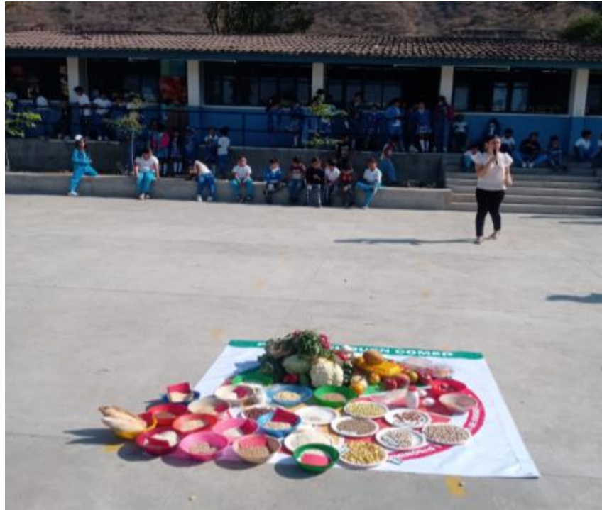
Ilustración 4 pláticas de orientación alimentaria desayunos escolares