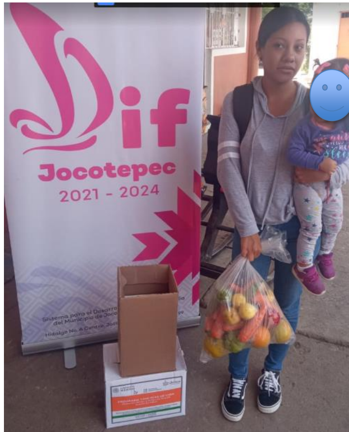
Ilustración 3 Entrega de leche, despensa, fruta y verdura 1000 días de vida