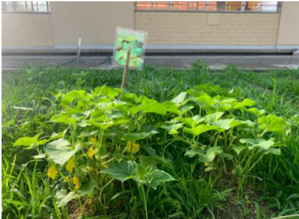
Ilustración 7 Huerto escolar desayunos escolares