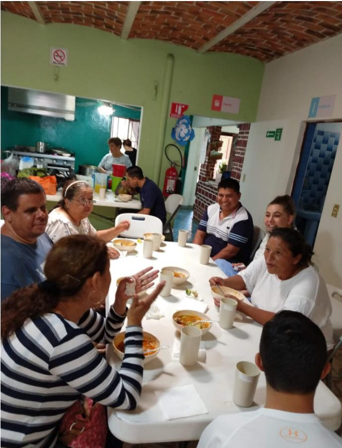
Ilustración 22 Día de las madres comedores asistenciales