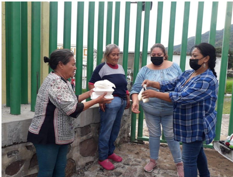
Ilustración 27 ENTREGA DE COMIDA SAN JUAN COSALÁ APCE