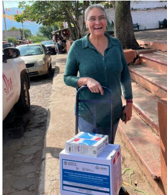
Ilustración 2 Entrega de leche y despensa PAAP