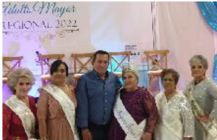
Ilustración 36 Certamen regional embajadora de los adultos mayores