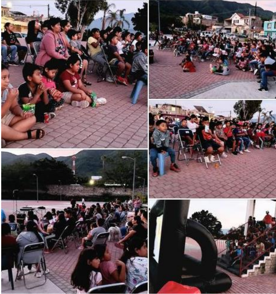
Ilustración 23Cine en tu barrio

https://www.facebook.com/Jocotepecgob/videos/seguimos-fortaleciendo-a-la-comunidad-en-cada-delegaci%C3%B3n-y-agencia-municipal-con/699400807834904/ VIDEO DE FESTIVAL FOCO