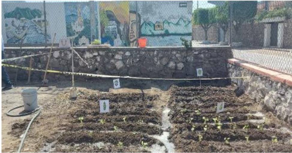
Ilustración 6 Instalación de huertos escolares desayunos escolares