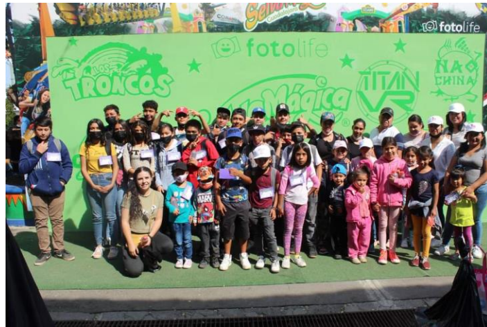
Ilustración 16 Visita al zoológico y selva mágica

https://www.facebook.com/JocotepecDIF/posts/pfbid02zorS3Dn8f1JocfZ9Y21Jib1ZVP9wzAeiHosa uqy2homrmNzqPwysMK4mxdBbC1rtl?_cft_[0]=AZUAuLqkAtsjRoistGfLx2zj7-nlEgJ2AH3wIPt_YMJVfKFAiPklnAe1aWGb5XlxA6p1GISLS0PYidGIPChxPXwPqZ_ilhd9y413oM5-8RqD8pAyb4Aod2B0Ehn8-8weYly6vlBO0V_C0gFuaAY63lhmEINks_vCuNnpzEG5N6KkU2Jvmo6Z70DqTH-QjPGXFQ-qZE9PVIR1RZMicoei5hUq&_tn_=%2C0%2CP-R VISITA AL ZOOLOGICO Y SELVA MAGICA