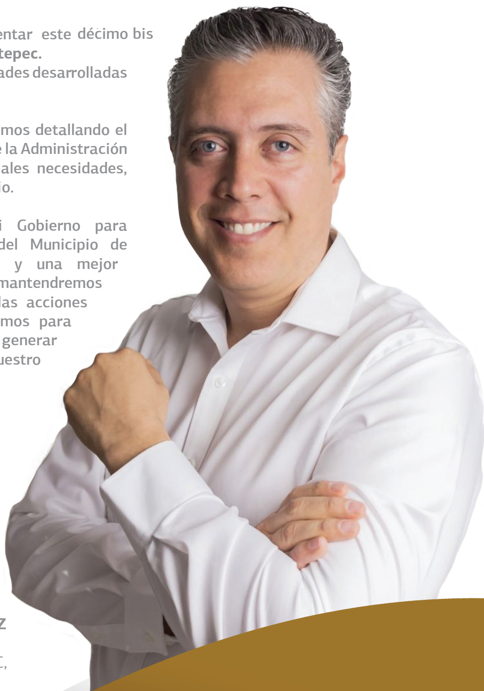
LIC. JOSÉ MIGUEL GÓMEZ LÓPEZ PRESIDENTE MUNICIPAL H. AYUNTAMIENTO DE JOCOTEPEC, JALISCO

Reitero el compromiso de mi Gobierno para garantizarle a los habitantes del Municipio de Jocotepec mayor transparencia y una mejor rendición de cuentas, por lo que los mantendremos informados constantemente de las acciones y estrategias que implementaremos para mejorar las condiciones sociales y generar una transformación en pro de nuestro Municipio.