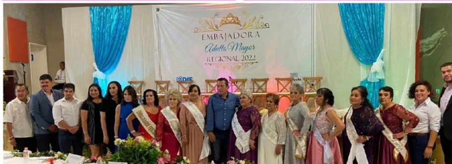
EVENTO EMBAJADORA DEL ADULTO MAYOR