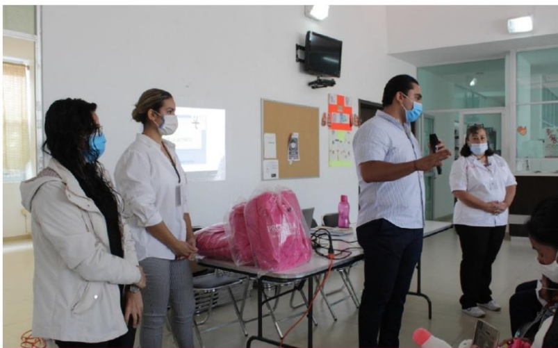
EVENTO SEMANA DE LA LACTANCIA