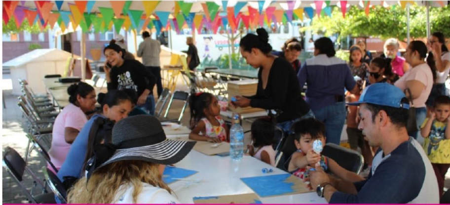
EVENTO DÍA DEL NIÑO, CREA Y RECREA