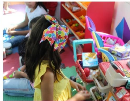
EVENTO DÍA DEL NIÑO, CREA Y RECREA