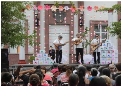
EVENTO DÍA DE LA MADRES